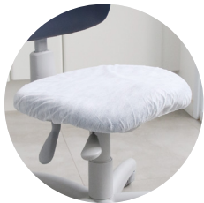
Protetor para assento de mocho 20g pct c/ 50 und