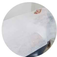
Campo fenestrado 1,20x0,70cm 30g pct c/ 25 und