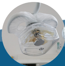
Protetor para refletor circular 20g pct c/ 50 und