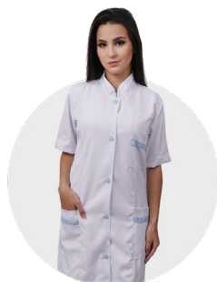
Jaleco microfibra manga curta feminino / masculino P / M / G / GG pct c/ 1 und