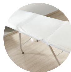
Lençol com elástico 2,10x90cm 20g e 30g pct c/ 10 und