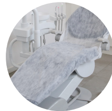
Protetor para cadeira com elástico 2,00x0,70cm 20g pct c/ 10 und