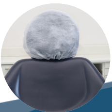
Protetor para encosto de cabeça 20g P / M / G / GG pct c/ 50 und