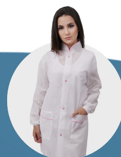
Avental lavável manga longa 50g com botões, viés rosa punho de tecido P / M / G / GG pct c/ 3 und