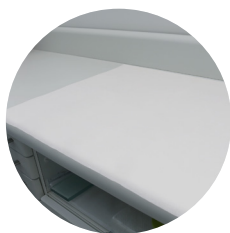
Campo para mesa 1,20x0,70cm 30g pct c/ 25 und