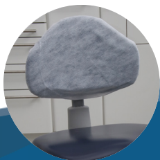
Protetor para encosto de mocho 20g pct c/ 50 und