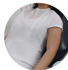
Babador descartável com tiras 30g modelo adulto pct c/ 50 und