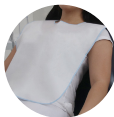
Babador de plástico com velcro e viés modelo adulto pct c/ 5 und