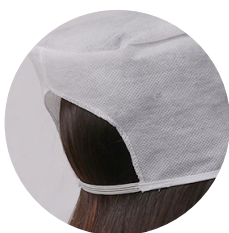
Gorro lavável com elástico 50g pct c/ 10 und