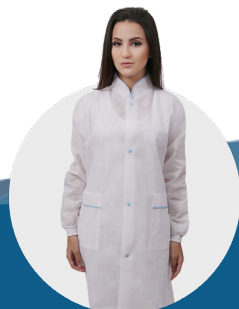
Avental lavável manga longa 50g com botões, viés azul punho de tecido P / M / G / GG pct c/ 3 und