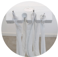
Protetor de mangueira 20g pct c/ 50 und