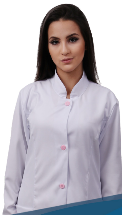
Jaleco microfibra manga longa feminino / masculino P / M / G / GG pct c/ 1 und