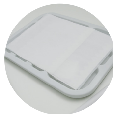
Campo para bandeja 20x30cm 30g pct c/ 50 und