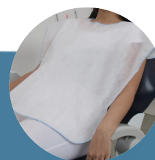
Babador lavável com velcro e viés 50g modelo adulto pct c/ 5 und