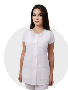
Avental lavável sem manga 50g com botões, viés colorido feminino P / M / G / GG pct c/ 3 und