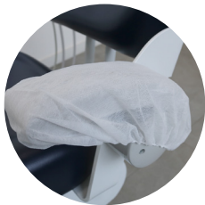
Protetor para braço de cadeira com elástico 20g pct c/ 50 und