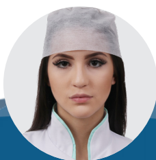
Gorro descartável com elástico 20g pct c/ 50 und