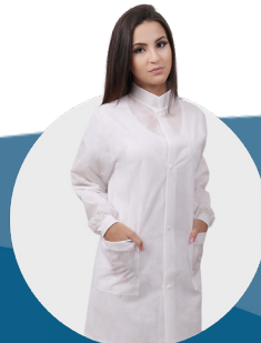
Avental lavável manga longa 50g com botões, punho de tecido P / M / G / GG pct c/ 3 und