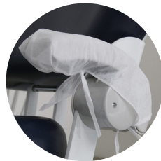
Protetor para braço de cadeira com tiras 20g pct c/ 50 und