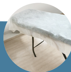
Lençol sem elástico 2,00x90cm 20g e 30g pct c/ 10 und