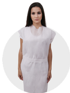
Avental descartável 20g e 30g modelo paciente sem manga com amarras na cintura e no pescoço pct c/ 10 und