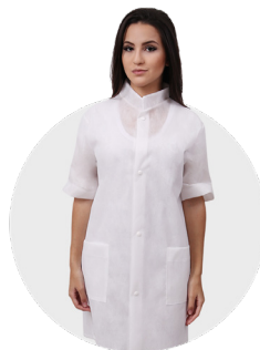
Avental lavável gola padre 50g manga curta com botões P / M / G / GG pct c/ 3 und