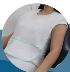
Babador endodontia 50g modelo adulto pct c/ 1 und