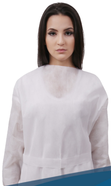
Avental descartável manga longa 20g, 30g e 40g amarrias na cintura, pescoço e punho elástico pct c/ 10 und