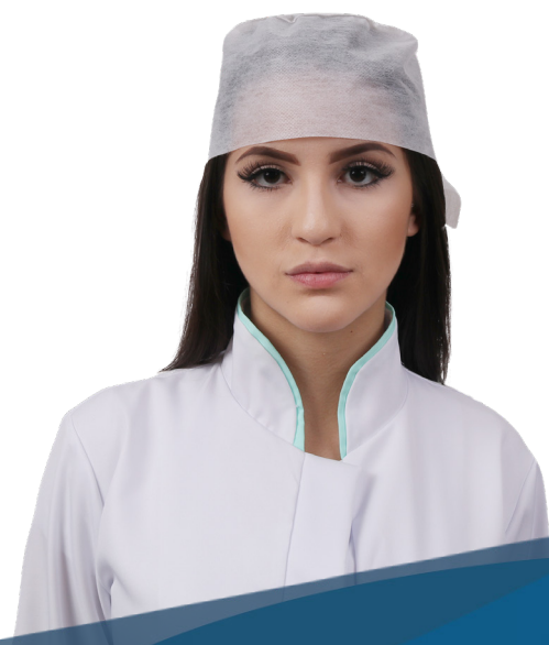
Gorro descartável com tiras 20g e 30g pct c/ 50 und